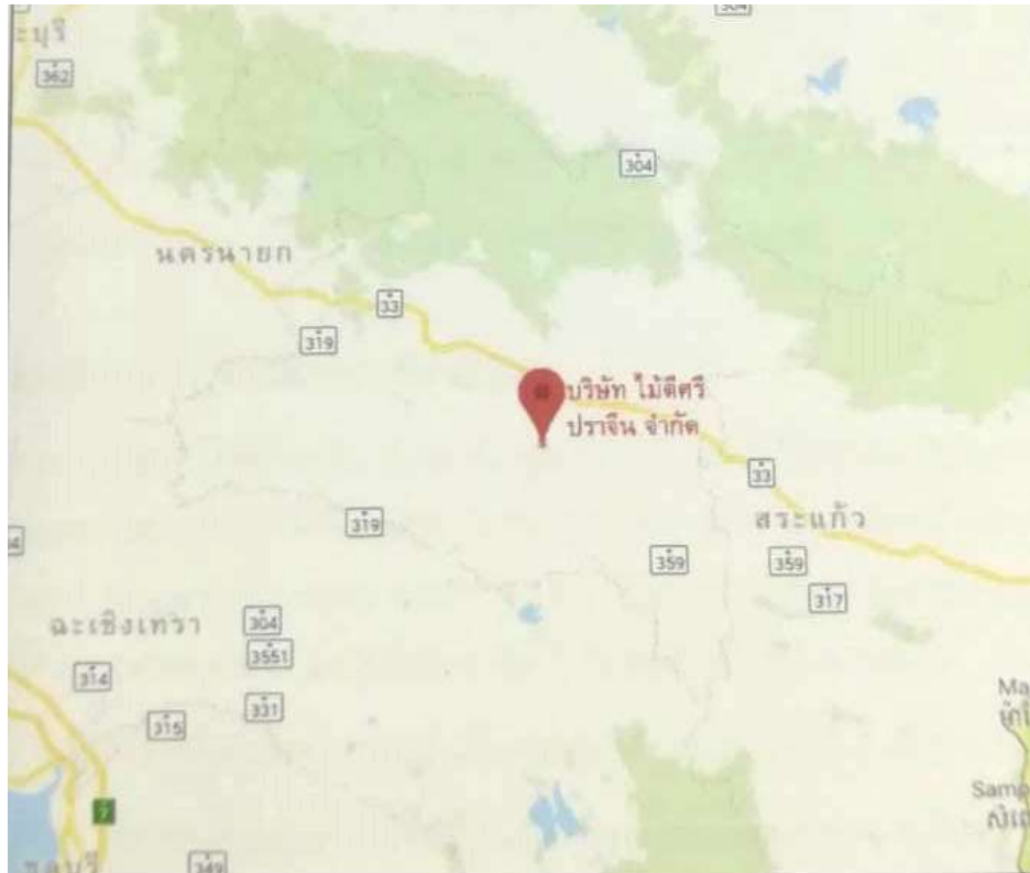
รูปภาพ : ที่ตั้งของสำนักงานบริษัท ไม้ดีศรีปราจีน จำกัด

บริษัท ไม้ดีศรีปราจีน จำกัด ตั้งอยู่ที่ 616 หมู่ 5 ตำบลลาดตะเคียน อำเภอพนมทวนบุรี จังหวัดปราจีนบุรี ห่างจากอำเภอเมืองปราจีนบุรีประมาณ 22 กิโลเมตร และห่างจากกรุงเทพฯ ประมาณ 150 กิโลเมตร